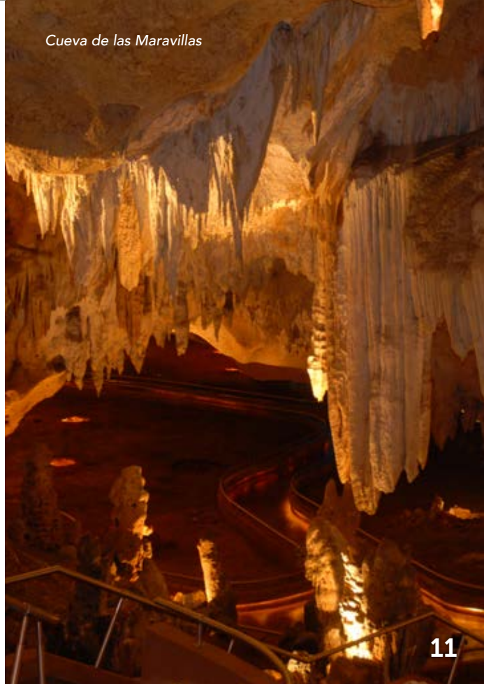
Cueva de las Maravillas

CUEVA DE LAS MARAVILLAS: Ubicado entre San Pedro de Macorís y La Romana, es hogar de las muestras más importantes del arte rocoso y presenta increíbles formaciones en piedras, principalmente estalactitas, estalagmitas y columnas geológicas. Este fascinante sistema de cuevas contiene cientos de petroglifos, pictogramas y grabados muy bien preservados, creados por los indios Taínos quienes la habitaron hace miles de años. Este lugar es muy accesible para los visitantes, pues posee un excelente sistema de iluminación, rampas, caminos y un moderno elevador. La Cueva de las Maravillas está abierta de martes a domingo, de 10.00 a.m. a 5.00 p.m. www.cuevadelasmaravillas.com