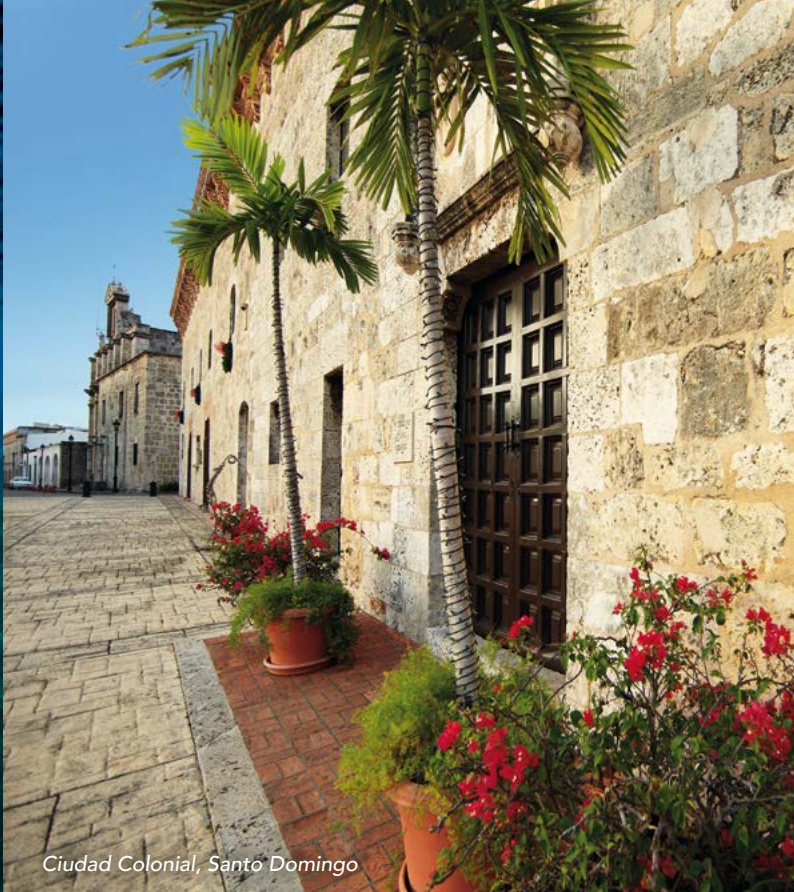
Ciudad Colonial, Santo Domingo

ISLA SAONA: Partiendo desde Bayahibe y pasando el Canal de Catuano se llega a la Isla Saona, la excursión más popular de los turistas que visitan el área. La isla forma parte del Parque Nacional Cotubanamá, y sus playas de ensueño fueron seleccionadas como unas de las mejores del Caribe. Sus aguas turquesas y vírgenes, y sus palmeras exuberantes hacen que sea una de las regiones más encantadoras de República Dominicana.