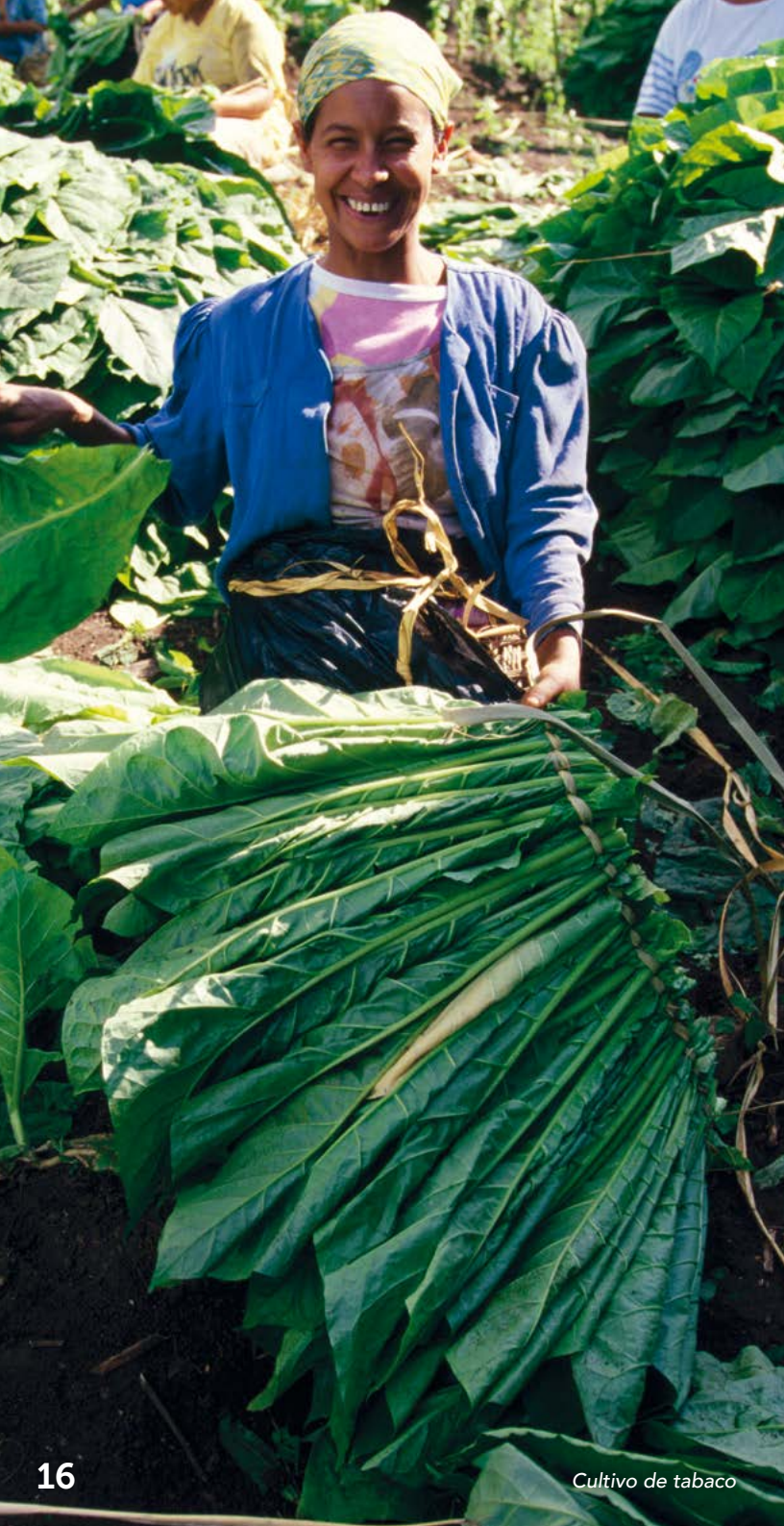
Cultivo de tabaco

TOURS DE CIGARROS: Los visitantes pueden presenciar el orgullo de los hombres y mujeres experimentados en la creación de cigarros hechos a mano en La Estancia, La Romana. En este tour podrás aprender sobre las bóvedas de envejecimiento del tabaco, su preparación, la formulación de mezclas de tabaco, laminado a mano y su embalaje final. La exclusiva tienda de cigarros ofrece la mejor selección y los mejores precios para cigarros premium dominicanos, incluyendo La Flor Dominicana, el cigarro premium más premiado en la última década. Abierto todos los días desde 8 a.m. a 5 p.m. www.cigarcountrytours.com