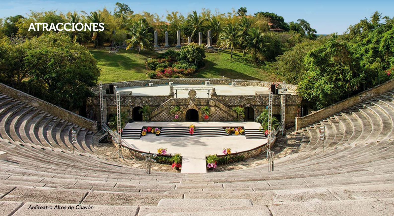
Anfiteatro Altos de Chavón