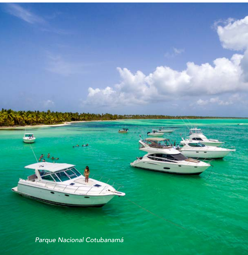
Parque Nacional Cotubanamá