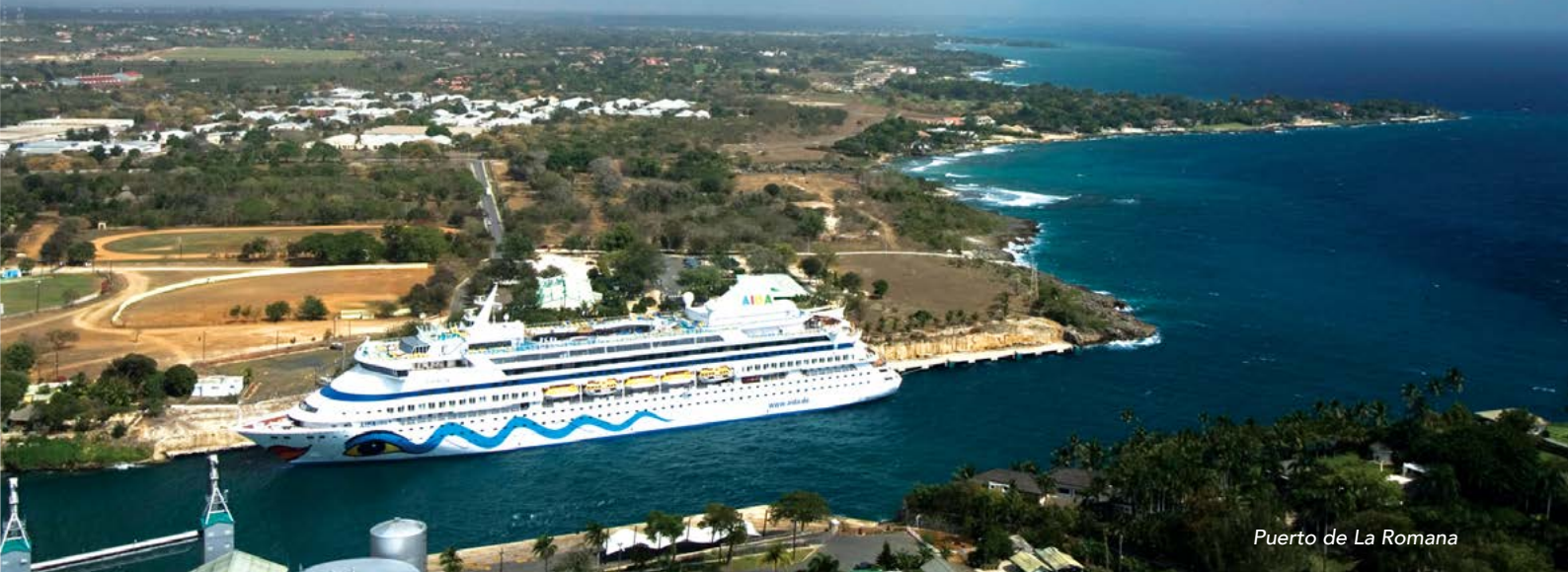
Puerto de La Romana

República Dominicana ocupa dos tercios del lado este de la isla Hispaniola, la cual comparte con la República de Haití, y es el segundo país más grande del Caribe con un área de 49.967 km 2 . Tiene una población de cerca de 10,5 millones y disfruta de un soleado clima tropical durante todo el año. La temperatura promedio oscila entre los 25 °C y 31 °C. La temporada más fresca es de noviembre a abril, mientras la más cálida es de mayo a octubre.